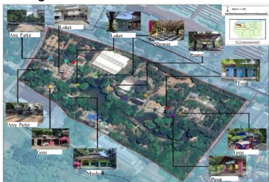
Gambar 5. Amenitas Wisata di Semarang Zoo (Observasi, 2024)

Amenitas dalam konteks pariwisata merupakan fasilitas pendukung dalam memenuhi kebutuhan/ keinginan serta kenyamanan wisatawan di destinasi wisata (Purwaningrum & Ahmad, 2022). Bentuk amenitas bisa berupa toko souvenir, restoran/ cafe, ruang kesehatan, dan lain sebagainya. Pada kebun binatang Semarang Zoo sudah terdapat berbagai amenitas yang tersebar merata di beberapa titik, antara lain area parkir yang dapat digunakan untuk kendaraan pribadi ataupun kendaraan umum, toilet yang berada di lokasi strategis dalam Kawasan,