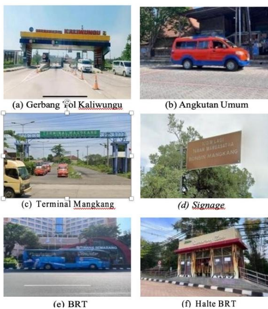
Gambar 4. Aksesibilitas Wisata Semarang Zoo (Observasi, 2024)

Komponen aksesibilitas dalam pariwisata mencakup mengenai ketersediaan dan kemudahan akses untuk menuju ke destinasi wisata, yang meliputi infrastruktur transportasi seperti, jalan raya, terminal, stasiun, angkutan umum serta signage , yang dapat memudahkan wisatawan untuk menuju destinasi wisata (Purwaningrum & Ahmad, 2022).