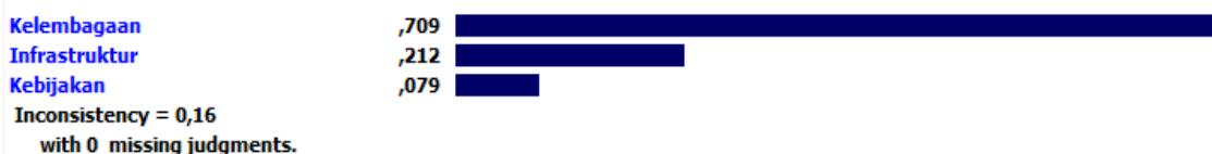
Gambar 3. Prioritas Pengembangan Ekonomi Kreatif Pada Setiap Kriteria

Pada hasil di atas dapat kita lihat bahwa dari tiga aspek yang menjadi prioritas untuk dikembangkan sebagai upaya kemajuan ekonomi kreatif di Kota Semarang, aspek kelembagaan menjadi aspek yang paling penting diantara dua aspek lainnya yaitu infrastruktur dan kebijakan. Aspek kelembagaan dianggap penting sebanyak 70,9%, sangat tinggi dibanding dua yang lain yaitu infrastruktur yang memiliki nilai sebanyak 21,2% dan yang paling rendah adalah 7,9% yaitu aspek kebijakan.